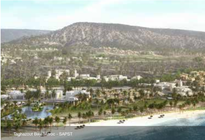
Taghazout Bay, Maroc - SAPST