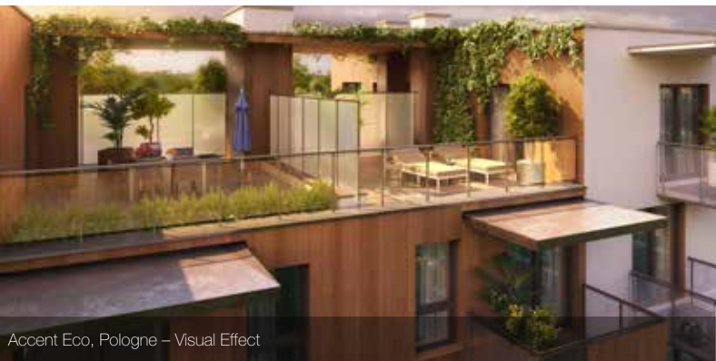
Accent Eco, Pologne – Visual Effect